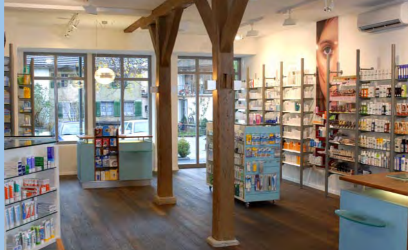
Wyland Apotheke, Andelfingen

Durch den verstärkten Preiskampf sind Dienstleistungen mit emotionaler Kundenbindung und ein vielseitiges Warenangebot in Frei- und Sichtwahl nötig.