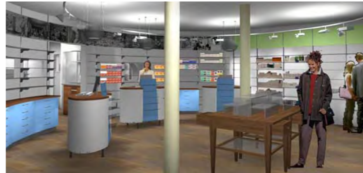
Apotheke Susten, Susten

Die Aufmerksamkeit Ihrer Kunden lässt sich durch eine geschickte Ladengestaltung beeinflussen. Wir beraten Sie und erarbeiten gemeinsam mit Ihnen die künftigen Schwerpunkte sowie Ausrichtung und Stil Ihrer »neuen« Apotheke. Realitätsnahe Visualisierungen unterstützen den Findungsprozess. Ein Umbau benötigt meist weniger finanzielle Mittel als Sie erwarten. Was vor allem zählt, sind gute Ideen und eine professionelle Umsetzung.