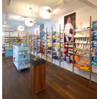
Wyland Apotheke, Andelfingen

Klar strukturiert, übersichtlich, natürliche Materialien: Die Wohlfühlapotheke